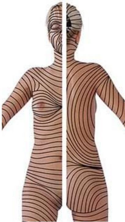
Рисунок 1. Лінії Лангера