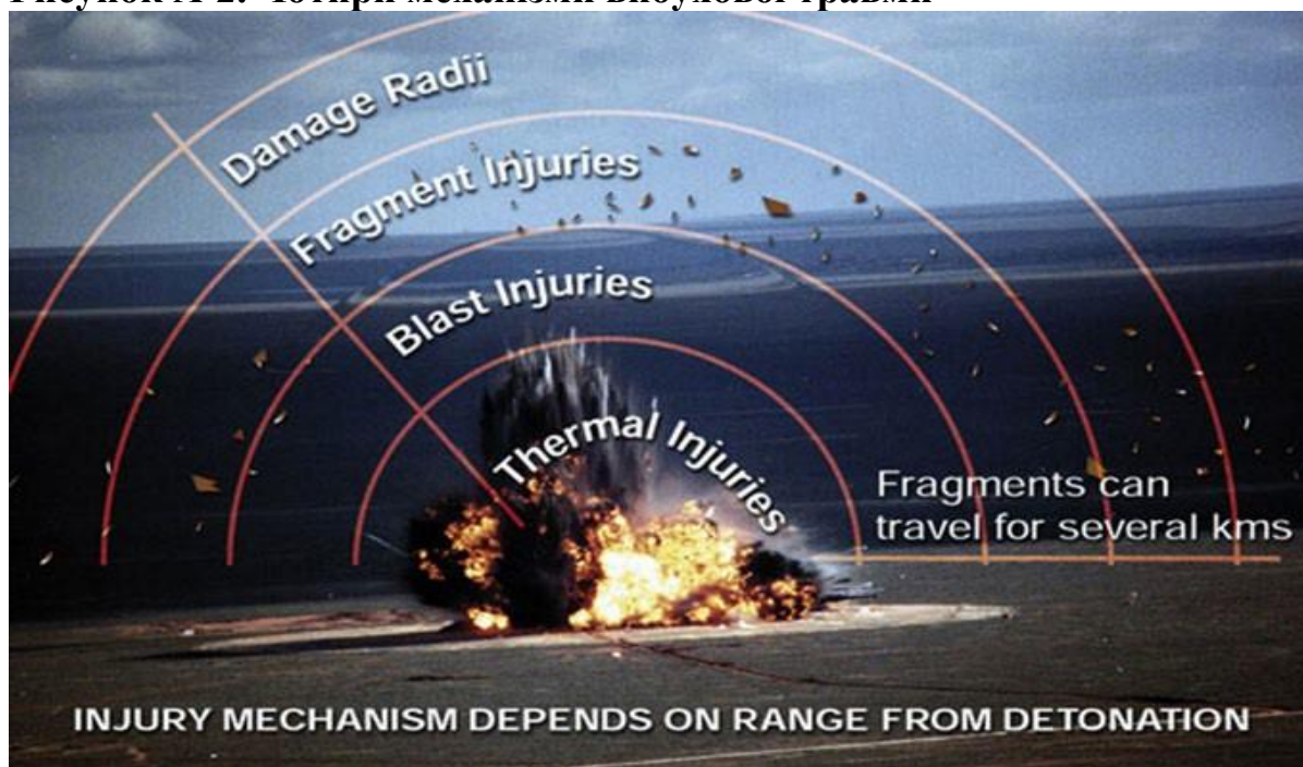
Рисунок А-2. Чотири механізми вибухової травми

Вторинні вибухові травми — це проникаючі поранення внаслідок ураження елементами, з яких складається боеприпас, або уламками навколишніх предметів, що приводяться в рух вибухом. Третинні вибухові травми складаються з двох підтипів поранень. Перший виникає внаслідок хвилі негативного тиску, відомого як вибуховий вітер, що спостерігається після позитивного тиску вибухової хвилі. І вибуховий вітер, і вибухова хвиля спричиняють схожі поранення. Другий підтип поранення — це тупа травма внаслідок удару великими предметами або удару тіла об навколишні предмети, такі як стіна або ґрунт. Коли під дію вибуху потрапляє транспортний засіб, ті, хто перебуває всередині, отримують поранення внаслідок послідовних хвиль тиску, що відбиваються від поверхонь всередині транспортного засобу. Четвертинні вибухові травми також складаються з двох основних підтипів. Перший — це опіки, лікування яких описане в документі JTS Burn Care Clinical Practice Guideline . Другий підтип — це хімічні, біологічні, радіологічні, ядерні та середовищні поранення (Chemical, Biological, Radiological, Nuclear, and Environmental Injuries, CBRNE), лікування яких виконується згідно з настановами CBRNE guidelines .